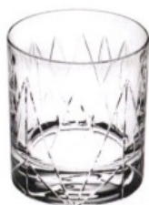
PURA TRANSPARENCIA Vaso de cristal, de Vista Alegre [c.p.v.].