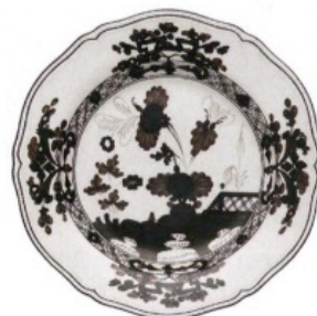
ESTAMPADOS Plato pintado, de Ginori 1735 [c.p.v.].