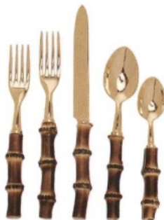
CON MADERA Cubiertos, de Giambattista Valli para Moda Domus [726 € el set].