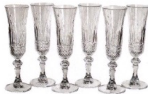
PARA EL BRINDIS Juego de copas, de Mario Luca Giusti [211 €].