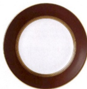
ATEMPORALES Plato con filo, de Wedgwood [73 €].

→VIDRIO POR DOQUIER Cristal, cristal y cristal parece ser su máxima en esta mesa de invierno para aportar frescura y luminosidad al conjunto. Como truco de experta, ella combina jarrones lisos con otros labrados.