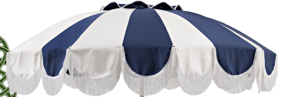
PARASOL en nylon, aluminium et tissu, Mezzatorre Umbrella , h 80 cm, 720 €. ISSIMO.