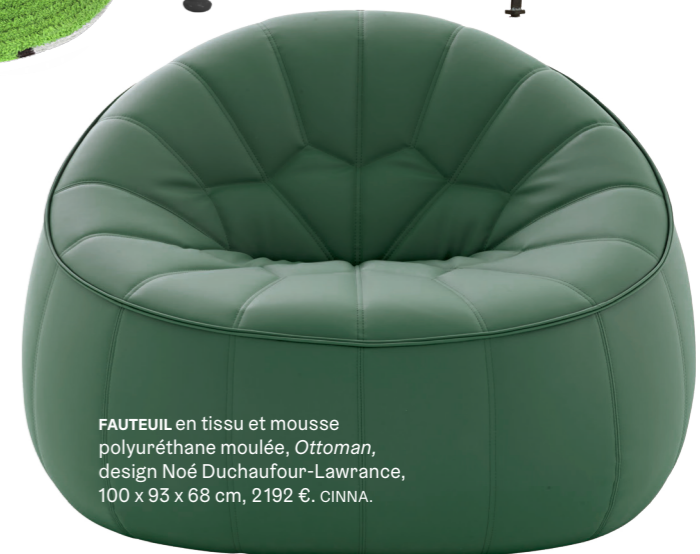
FAUTEUIL en tissu et mousse polyuréthane moulée, Ottoman , design Noé Duhaufour-Lawrance, 100 x 93 x 68 cm, 2192 €. CINNA.