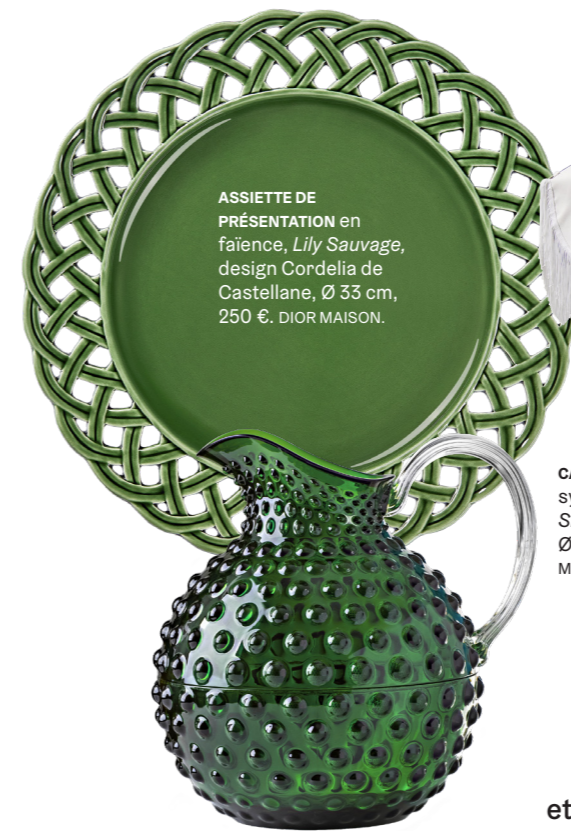
ASSIETTE DE PRÉSENTATION en faïence, Lily Sauvage , design Cordelia de Castellane, Ø 33 cm, 250 €. DIOR MAISON.

SUR LE LAC DE CÔME, la piscine de l'Hôtel Passalacqua dessinée par Valentina De Santis, en collaboration avec La Double J et l'artisan expert Guido Toschi.