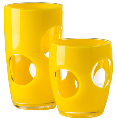
Mario Luca Giusti Fischaugen-Glas und -Tumbler in fünfzehn weiteren Farben ab CHF 24.-