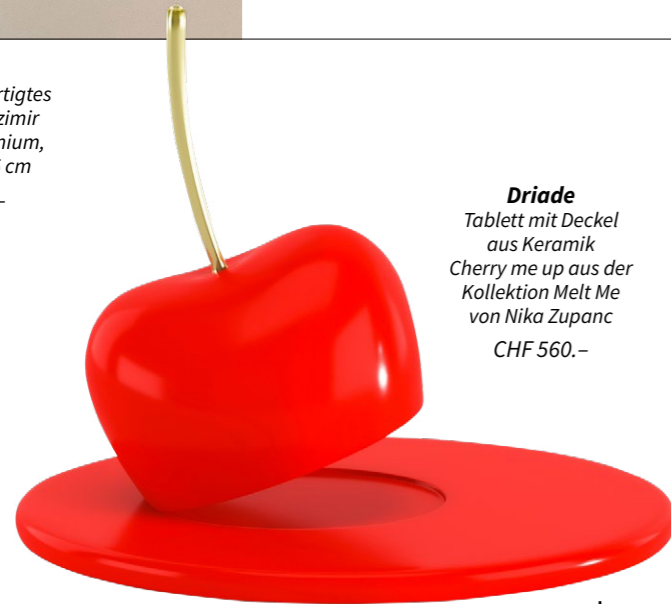
Driade Tablett mit Deckel aus Keramik Cherry me up aus der Kollektion Melt Me von Nika Zupanc CHF 560.-