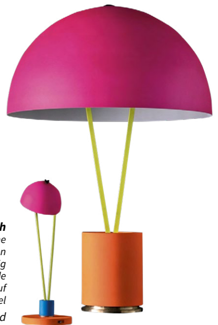
Catellani & Smith Batteriebetriebene Tischleuchten Ale Be T und Ale Big mit Kabel, beide mit Fliege auf der Halbkugel CHF 750.- und CHF 3700.-