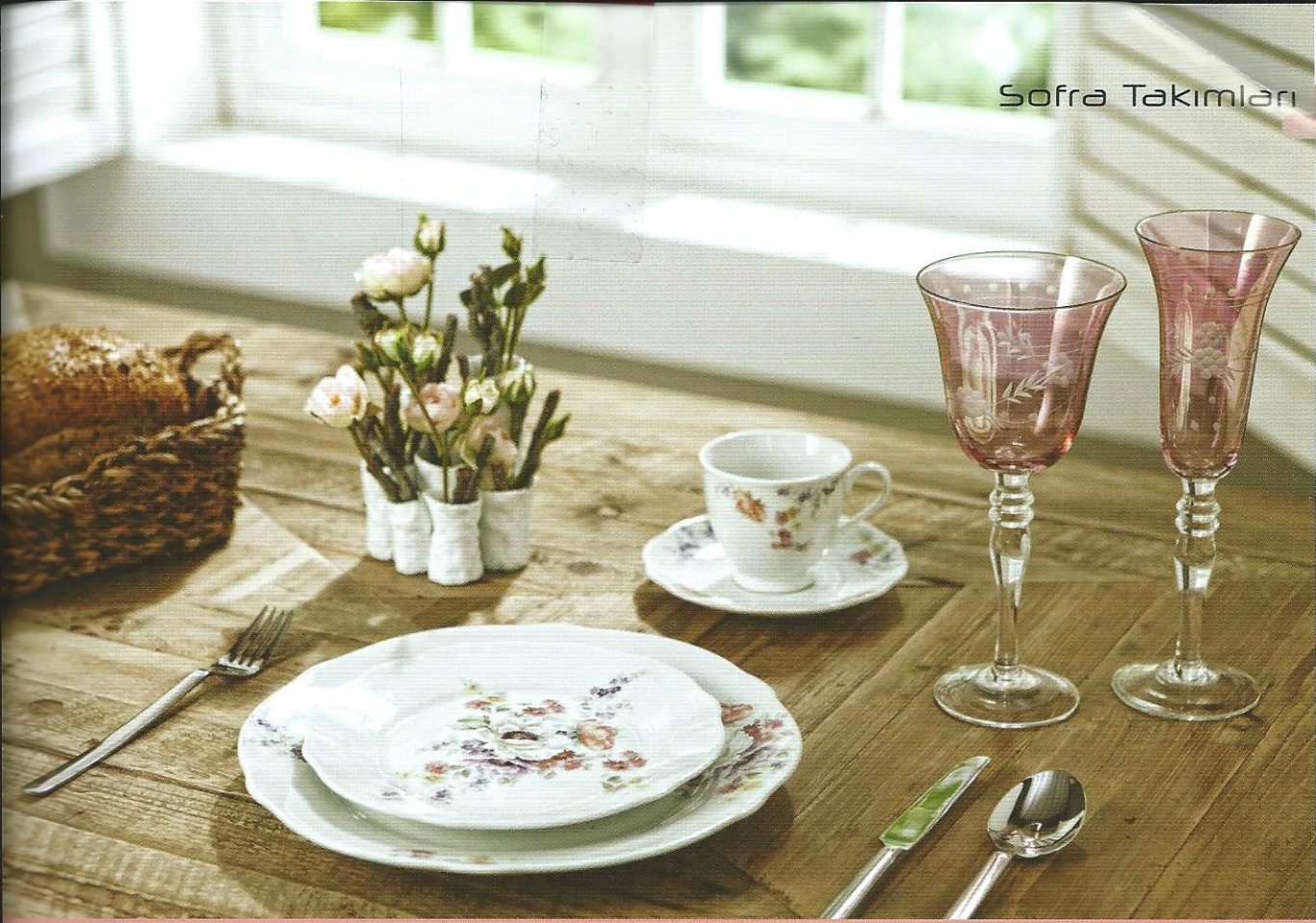
Baharın pastel tonları

Mudo Concept, 2013 ilkbahar-Yaz iç mekan koleksiyonunda çiçek figürlerini kullanmış. Pembenin en uçuk tonlarını yansıtan kadehler bahar figürleriyle süslenmiş. Tüm ürünler pastel bütünlüğü bozmayacak şekilde tasarlanmış. www.mudo.com.tr