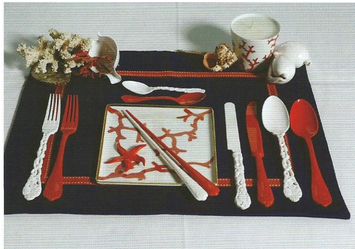
İtalyan renkleriyle elegan bir seri

Çağdaş masalar için yenilikçi materyaller kullanan Pandora Design, tasarım ödüllü koleksiyonuyla rengarenk sofralara imza atıyor.